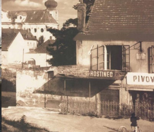
Břevnov, jak ho neznáme