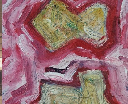
Vladimír Uhlík - Scrabs 14