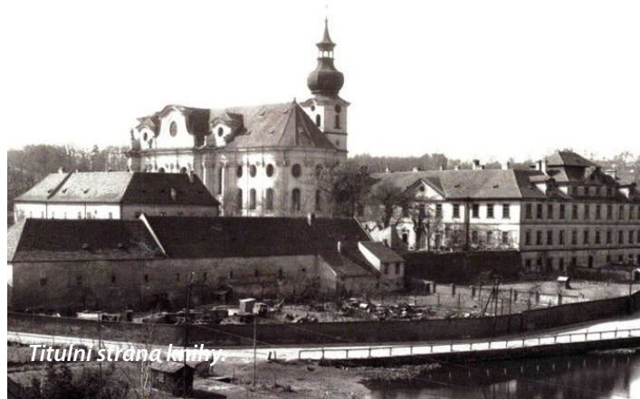
Titulní stránka knihy

budově muzea) také komentované vycházky. Za dva měsíce od zahájení výstavy jich stihli šest: 1/ Poutní areál Panny Marie Vítězné na Bílé hoře (založení barokního poutního místa na bělohorském bitevním poli, stavební historie a výzdoba, na níž se podíleli přední čeští a bavorské umělci 1. poloviny 18. století), 2/ Bazilika sv. Markéty (románská krypta v podzemí a prelatura s reprezentativními prostorami v Břevnovském klášterě), 3/ Zmizelý Břevnov (Břevnov a jeho krajina v závěru Rakousko-uherské monarchie ve 2. polovině 19. století, za první čs. republiky a proměny Břevnova v poválečném období způsobené výstavbou sídlišť a dopravních staveb), 4/ Vzpomínky na Břevnov (nejen staré domy, ale zejména rázovité postavy jeho obyvatel ve vzpomínkách pamětníků), 5/ Poutní cesta z Prahy do Hájků (400 let trvající historie, současnost i budoucnost poutní cesty, kudy vedla a jak vypadala slavná procesí putující Břevnovem přes Bílou Horu a Hostivici k dnes nejstarší loretánské stavbě v Čechách), 6/ Soumrak a zánik Velkého Břevnova (posledních 100 let vsi Břevnov, 1880-1980, změny v lokalitě způsobené společenským vývojem, osudy domů a jejich obyvatel). Zmíněná témata a navržené trasy mohou být inspirací pro letní toulky touto starobytlou částí Prahy 6.