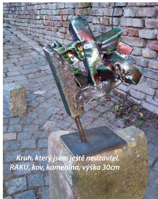
Kruh, který jsem ještě neuzavřel, RAKU, kov, kamenina, výška 30cm