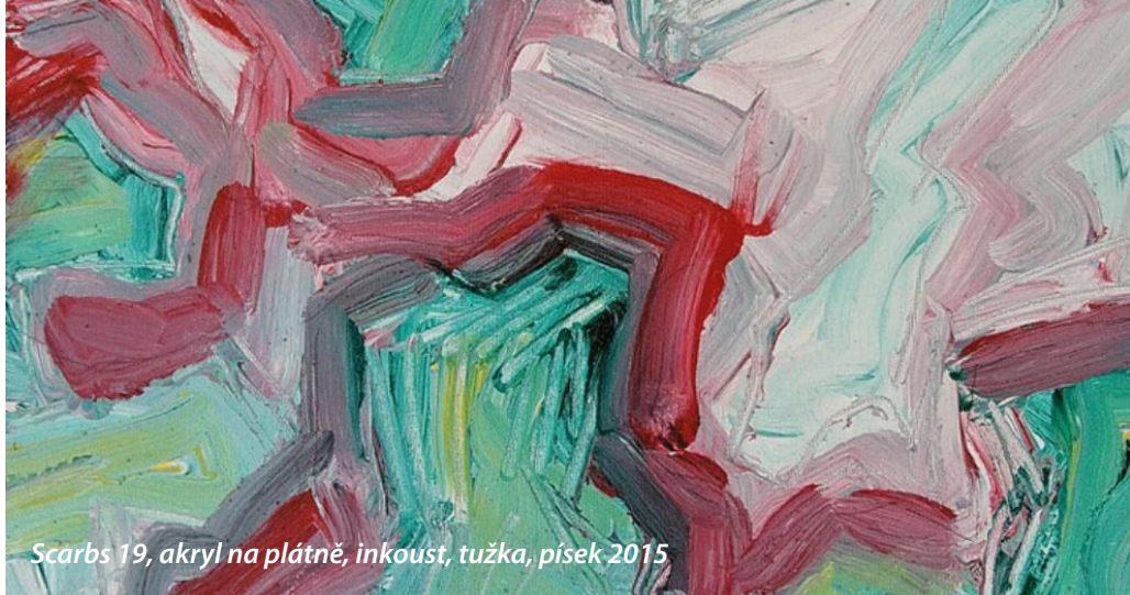
Scarbs 19, akryl na plátně, inkoust, tužka, písek 2015

Každý keramik a sklář řeší téma nádoby. Někdo se nádobě věnuje celý ži-