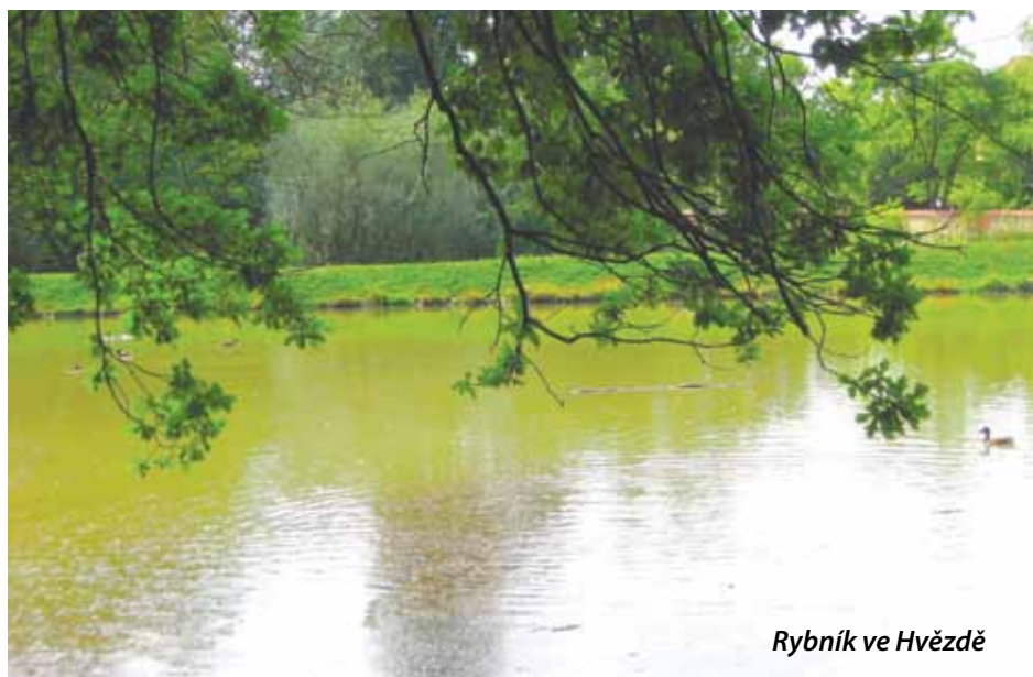
Rybník ve Hvězdě