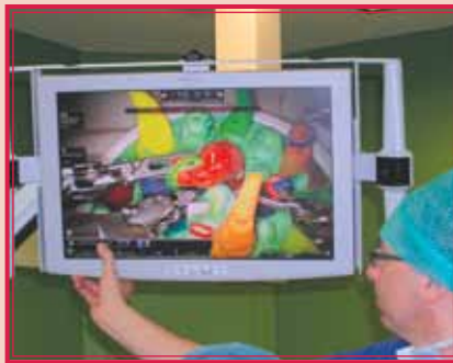
Nový robotický systém v ÚVN