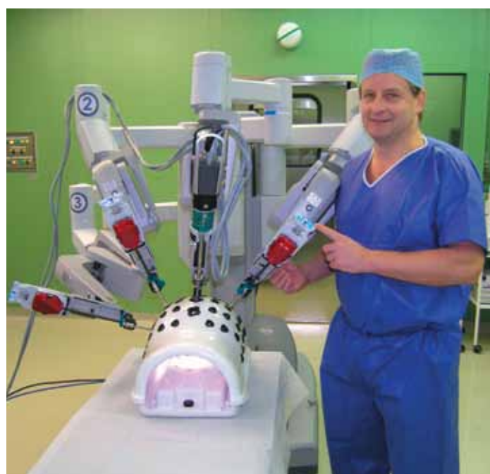
Trenažér robotického systému pro zaškolení lékařů